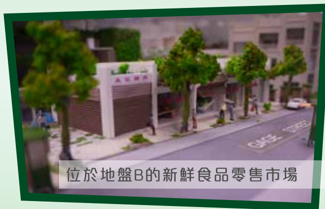
位於地盤B的新鮮食品零售市場

至於沒有參與遷回安排的商戶(包括非鮮貨店舖及不選擇遷回的鮮貨店舖)，市建局則與他們簽訂租約，讓他們繼續經營，協議每年按項目進展情況續約或終止租約，直至地盤需要施工為止。