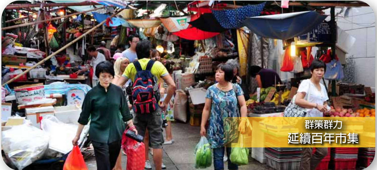
群策群力 延續百年市集