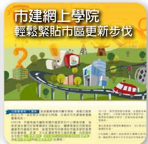
市建網上學院 輕鬆緊貼市區更新步伐