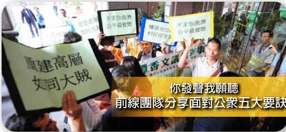
你發聲我願聽 前線團隊分享面對公眾五大要訣