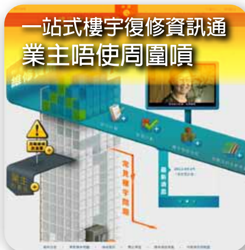
一站式樓宇復修資訊通 業主唔使周圍噴