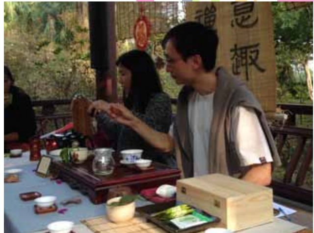
《龍城清芬》之清揚茶會雅集

在過去的一年多的周末，「蔚藍天」在九龍寨城公園舉辦茶藝工作坊，一共訓練了三班學員。透過茶會雅集向公眾奉茶，分享雅緻、慢活的茶文化。