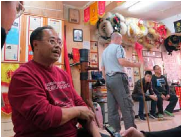
深水埗 * 我想住嘅地方

「文化工作坊」舉辦故事寫作工作坊，由陳雲博士帶領大學生及中學生，訪問駐紮深水埗多年的街坊，為社區風物誌搜羅素材。另一邊廂，一些深水埗區的中學生，在學習攝影、道具及服裝製作後，透過影像把深水埗社區的故事呈現出來。