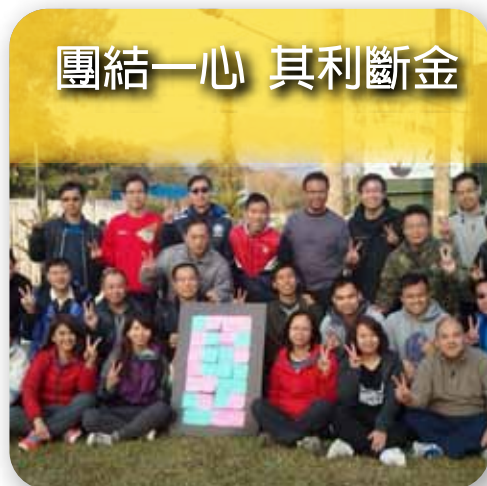
團結一心 其利斷金